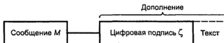
Рисунок 1 - Схема подписанного сообщения

Схематическое представление подписанного сообщения показано на рисунке 1.